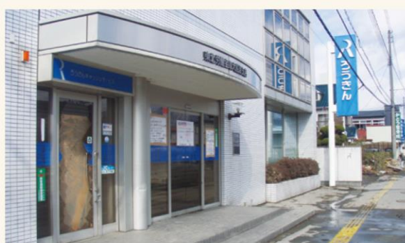
▲東日本大震災発生直後の大船渡支店(2011年3月)

多くの皆さまにこの展示室をご覧いただき、東北各地域の災害体験が風化することなく、後世に伝えられていくことで、今後の災害時対応の一助となれば幸いに存じます。