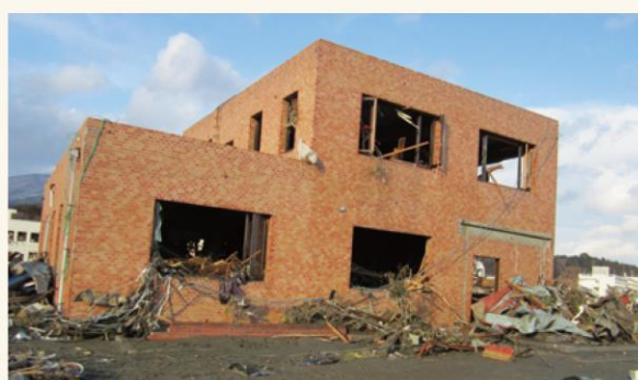
▲東日本大震災発生直後の高田支店(2011年3月)