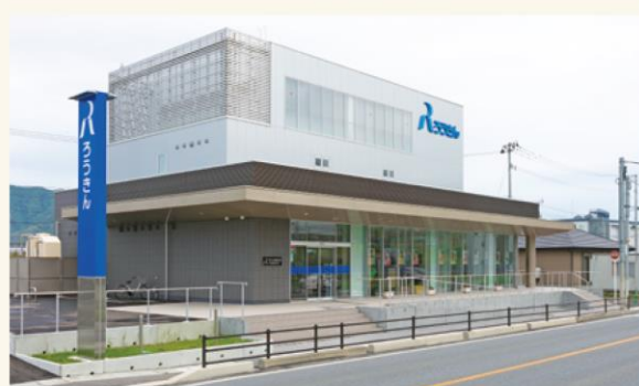
▲新店舗移転オープンした大船渡支店(2020年6月)