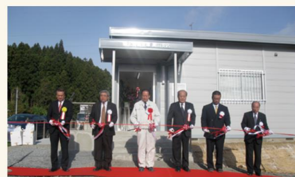
▲高田支店仮店舗オープンセレモニー(2011年11月)