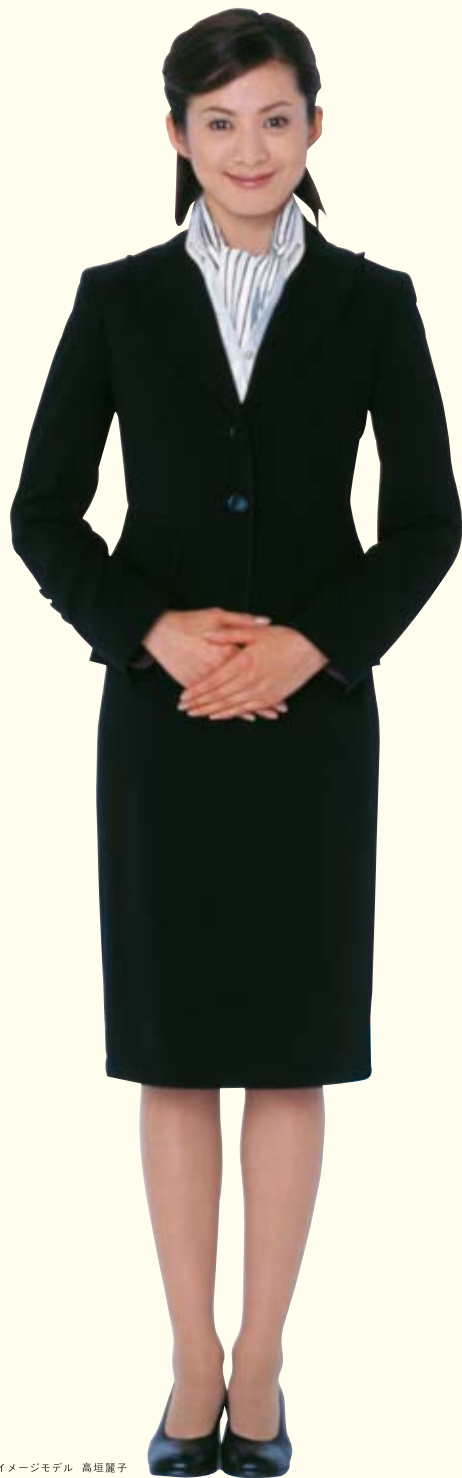
イメージモデル 高垣麗子